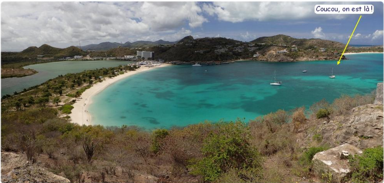
Deep Bay à Antigua vu du Goat Hill.

Changement d'environnement... après 10 jours à Barbuda presque sans signe de civilisation, nous voici face à des plages d'hôtels avec une musique de mauvais goûts qui nous donnerait presque envie de repartir vers d'autres cieux. Dommage car le cadre est jolie et il y a des tortues partout.